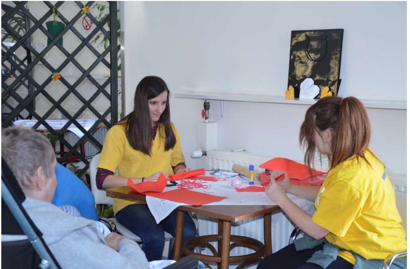
Serduszko dla Chorego