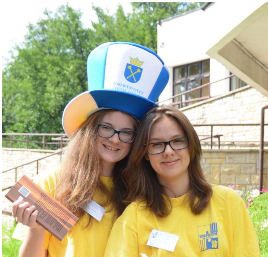
Czytanie i towarzyszenie