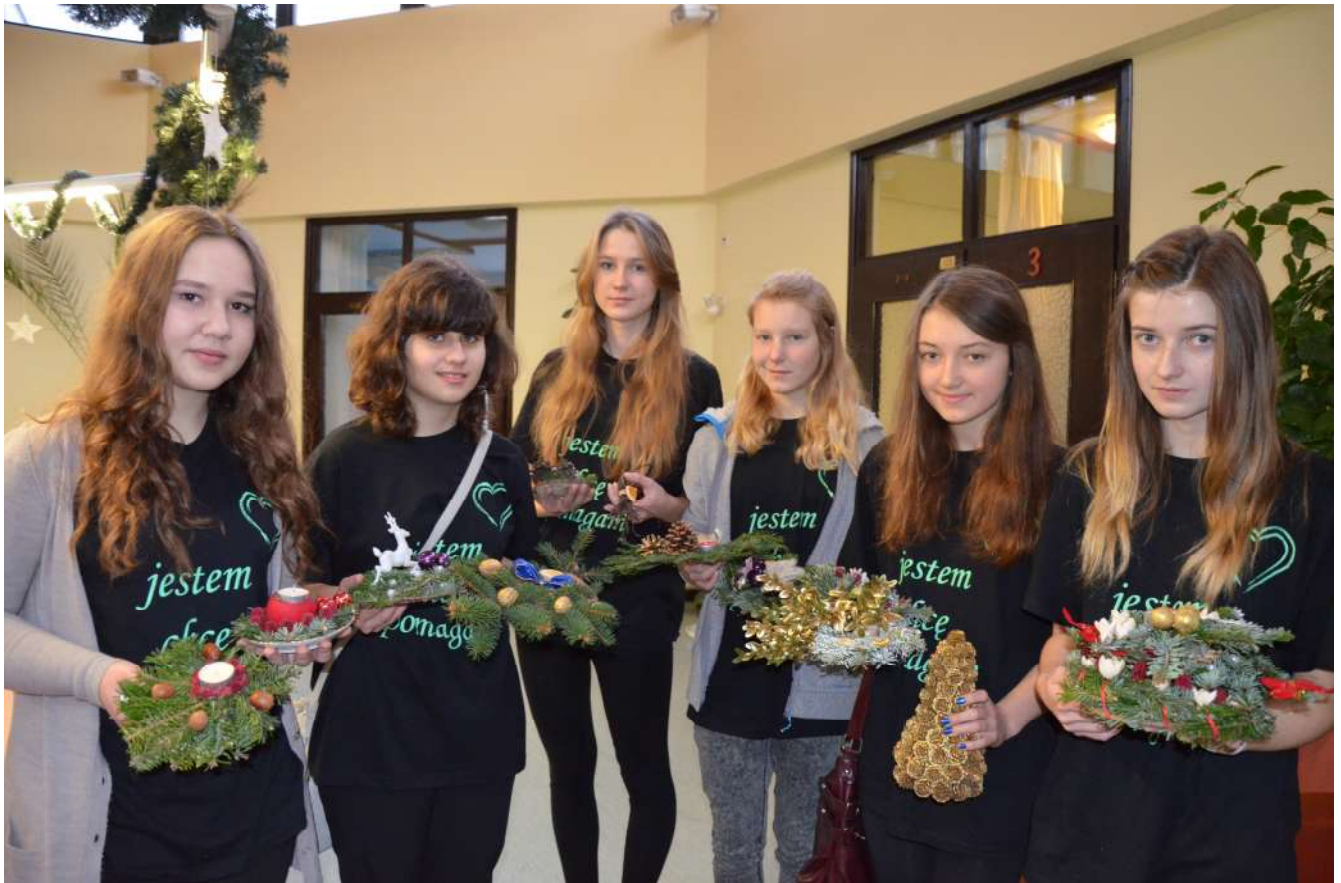
Dar dla Chorych